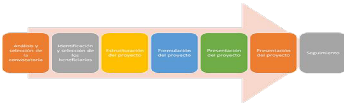
Ilustración 1: Proceso en la Formulación de Proyectos

ALCANCE: Inicia con la búsqueda de convocatorias de cooperación nacional e internacional, dicha información es organizada y valorada en una escala porcentual; Y finaliza con la difusión a los enlaces de internacionalización delegados por cada una de las dependencias de la Alcaldía del municipio de Neiva y comunidades interesadas en aplicar a las convocatorias.